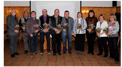
Blumengrüße und ein herzlicher Dank für den entlasteten Vereinsvorstand.