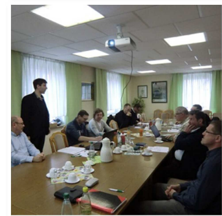
Archivbild: Sitzung AG Infrastruktur in Mildena

Zum 01. März wurden wieder neue Aufrufe zur Einreichung von Förderanträgen ländlicher Projektvorhaben gestartet. Nach dem Ende der Einreichungsfrist am 11. April finden am 29. April die themenbezogenen Arbeitsgruppensitzungen statt. Der Koordinierungskreis tritt am 22. Mai zusammen, um über die eingereichten Vorhaben zu beraten und per Votum für eine Förderung auszuwählen.