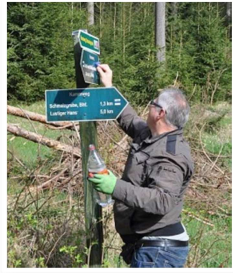
Fleißige Helfer beim Frühjahrsputz 2018 auf dem Preßnitztalweg.

auch in diesem Jahr für viele Besucher als attraktive Ausflugsroute zu gestalten, laden die angrenzenden Kommunen Wolkenstein, Großrückerswalde, Mildenaue und Jöhstadt zur gemeinsamen Aktion „Das Preßnitztal putzt sich raus“ am 27.04.2019 alle interessierten Wanderfreunde, Naturliebhaber und Vereine ein.